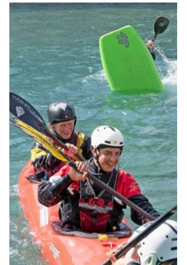
Beim Kanufahren wird man ab und zu nass...

Vor 75 Jahren wurde der Kanu-Klub Thun als Faltbootklub Thun gegründet. Deshalb wurde am Wochenende auf dem Mühleplatz ein Publikumsanlass mit allerlei Bootstypen auf die Beine gestellt. Die Besucher konnten Passagierfahrten auf der Aare geniessen, die unterschiedlichen Arten von Paddelbooten von nahem begutachten oder in Action bestaunen. Auf der Welle unter der Schleuse zeigten Wildwasserkünstler ihr Können. Im Beisein von Stadtpräsident Raphael Lanz (SVP) wurde eine Parade der unterschiedlichen Wasserfahrzeuge präsentiert. Danach liess es sich der Stadtpräsident nicht nehmen, mit dem Präsidenten